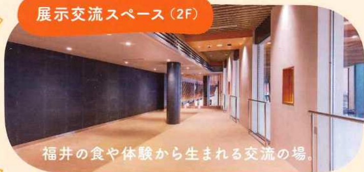
展示交流スペース（2F）