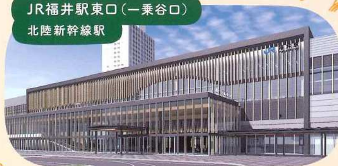
JR福井駅東口（一乗谷口） 北陸新幹線駅