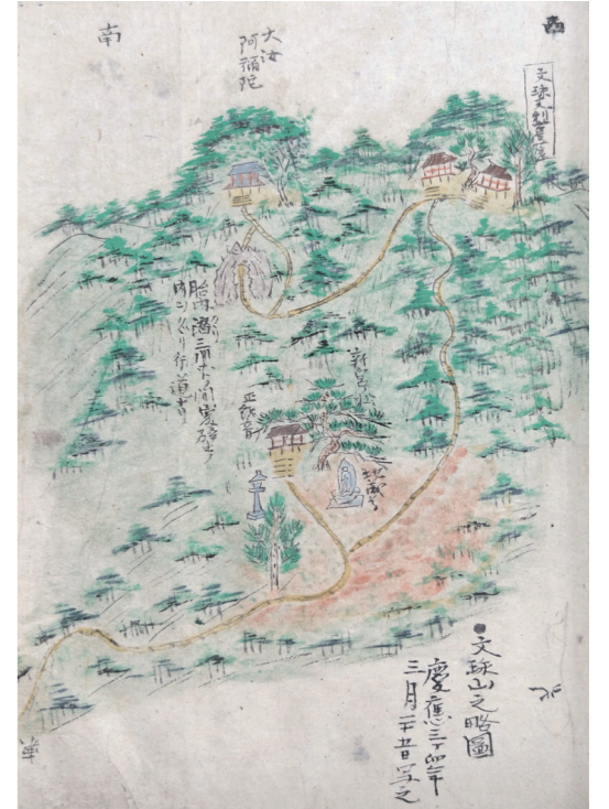
『越前国名蹟考』より文殊山之略図 当館蔵

そして本展では、文殊山麓に遺る白山信仰ゆかりの神像・仏像を紹介しています。まず福井市上河北町白山神社には、女神像を主神として東帯形の男神像や僧形神像など多数が祀られており、女神像は白山比咩神の姿を、残る男神像などが大汝や別山の神々の姿を表していると考えられます。