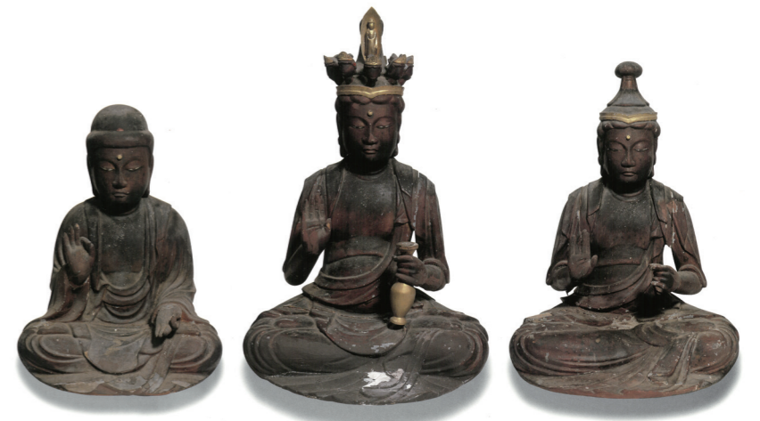
鯖江市指定文化財

なお、文殊山の山麓には古来いくつもの社寺が栄えていたと考えられ、その証拠として現在も多くの平安・鎌倉時代の仏像が遺されています。今回出展されているもののほかにも、福井市帆谷町の薬師如来坐像（福井市指定文化財）、福井市北山町の毘沙門天像、福井市大土呂町の聖観音立像、福井市半田町の毘沙門天像、福井市徳尾町の十一面観音立像（焼損）、鯖江市大正寺町の不動明王像（鯖江市指定文化財）などが現在も大切に祀られており、中世以前の隆盛を今に伝えています。