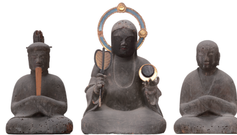
木造 男神坐像・女神坐像（福井市指定文化財）・僧形神坐像

泰澄大師が開いたという霊山「越前五山」の一つに数えられる文殊山。泰澄出生の地・麻生津にも面したこの山では、中世には白山信仰と文殊山信仰の混交が進んだものとみられます。白山三所権現の本地仏は、十一面観音（御前峰）、阿弥陀如来（大汝峰）、聖観音（別山）ですが、文殊山の本地仏は、『越前国名蹟考』によると、文殊菩薩（本山・大文殊）、阿弥陀如来（大汝・奥之院）、聖観音（別山・小文殊）となっており、主尊の十一面観音と文殊菩薩が入れ替わった以外は共通の二尊が配置されています。この三尊形式がいつまで遡るのかは定かではないですが、白山信仰の影響を受けたのは間違いないものと思われます。