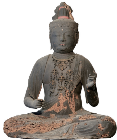
木造 文殊菩薩坐像 平安時代 楞嚴寺

五台山を参詣し帰国したのが10世紀後半で、これ以降、平安後期から鎌倉時代にかけて、日本国内で文殊信仰が高まっていきます。楞嚴寺本尊の文殊菩薩像が平安後期の作であることを併せて考えると、この頃に「文殊山」と呼ばれるようになったのではないかと考えられます。