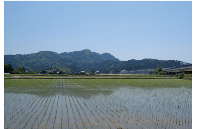
福井市太田町から望む文殊山

近年は気軽にハイキングが楽しめる里山として多くの人に親しまれている文殊山。一方文殊山は、奈良時代の名僧・泰澄が開いたとされる「越前五山」の一つに数えられる霊山であり、その山麓には文殊山信仰の拠点である楞嚴寺をはじめ、数多くの密教寺院が栄えていたと伝わります。本展では、文殊山ゆかりの仏像を中心に展示し、文殊山の深遠な歴史と信仰を紐解きます。