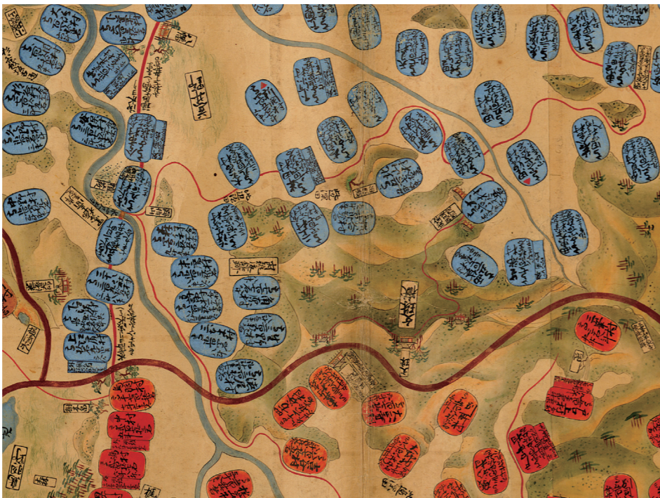
「越前国図」より文殊の周辺部分 貞享2年(1685) 松平文庫 福井県文書館保管

明治3年（1870）、大村の大火で成就院が焼失し、荒廃が続く時期もあったようですが、楞嚴寺は現在も本尊文殊菩薩像や県指定文化財の弘法大師像など多数の仏像を安置し、文殊山の法灯を守っています。